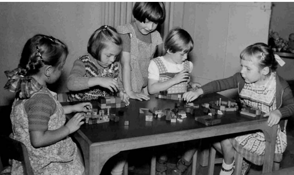
Das Spiel mit Bauklötzen regte damals wie heute die Phantasie an: Konzentriert tauschen die Mädchen untereinander einzelne Elemente für ihre Bauwerke aus. Sie tragen bunte Schürzen, um ihre Kleidung zu schonen.