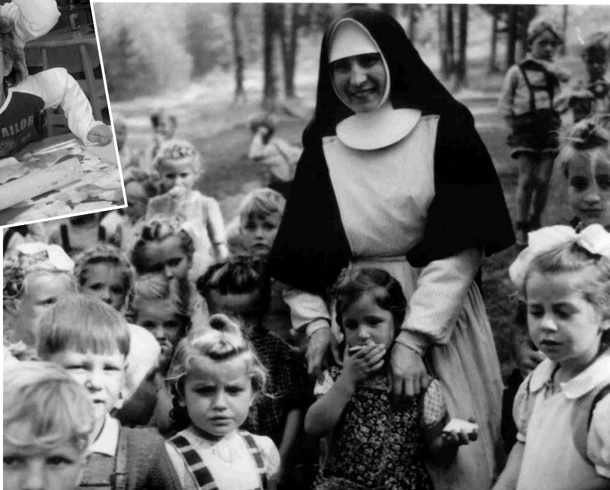
Über hundert Kinder besuchten anfangs den Klosterkindergarten. Da hatten die Schwestern alle Hände voll zu tun.