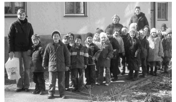
Regelmäßig gehen die Vorschulkinder zu Ausflügen und Exkursionen, wie hier zum Bäcker.