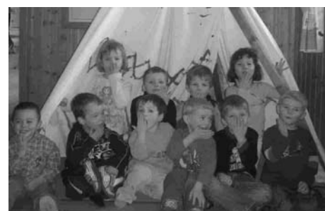
Die kleinen Indianer des Kindergartens haben auf dem Flur sogar ihr eigenes Zelt.

„Oft hat man ja Sorge, dass sich die Vorschulkinder in ihrem letzten Kindergartenjahr langweilen könnten. Aber die Erzie-