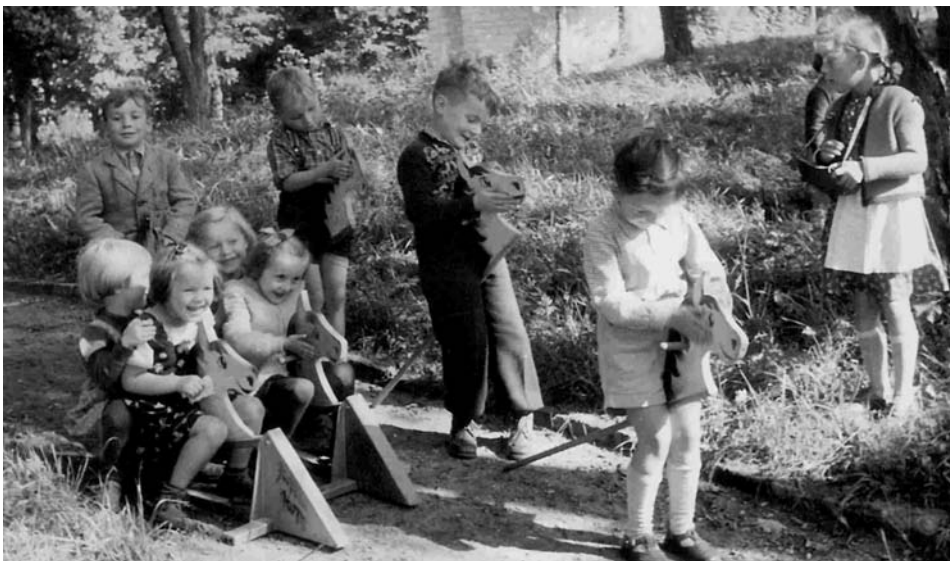
Einfache Stecken- und Schaukelpferde waren in den Fünfzigern begehrte Spielsachen der Kindergartenkinder.

Interview mit Schwester Bernharda und Beate Meckl